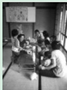
紙コップに小豆を入れてマラカス作り

私達、わらしこサークルは、楽しくお子様を交えて、読み聞かせ、手遊び、歌遊び、工作などをして、地域の方々とお心温まる交流を図るため、2008年4月に発足した、できたてホヤホヤの育児サークルです。小さいお子様がいらっしゃる方で、少しでも興味がある方は一度のぞいてみてください。スタッフ一同皆様のお越しを心よりお待ちしております。