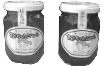
夏みかん・りんご(180g) 472円(税込)

知的障がい者の作業所「つばさふあくとりい」を運営する「つばさの会」との協働事業によるあいちゃんジャムは、国産で産地が確かな果物を使い、保存料・ゲル化剤・酸味料等は使用せず一つ一つを丁寧に手作りしています。品質管理も徹底しており、小さなお子様からご高齢の方まで皆様に安心して召し上がっていただけるジャムです。ぜひ一度ご賞味ください。