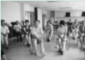
みんなで楽しく転倒予防体操

町田市三輪センターの一室をお借りして月1回サロンを開催しています。付近は公園や畑があり、緑が多く残っている恵まれた環境です。今年4月に開所したばかりのサロンです。参加者の希望を聞きながら企画し、歌ありおしゃべりありです。転倒予防の体操や頭の体操など介護予防を取り入れて、和やかな楽しいサロンになっています。毎回新しい方が参加していらっしゃいますので、ぜひお気軽にお出掛けください。お待ちしております。