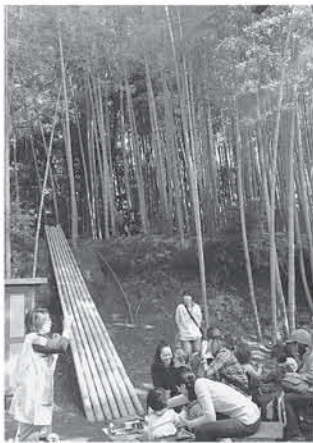
君の勇気が試される、竹のすべり台